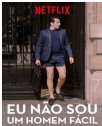
EU NÃO SOU UM HOMEM FÁCIL Assistir o filme com foco no empoderamento feminino (Comédia Francesa).