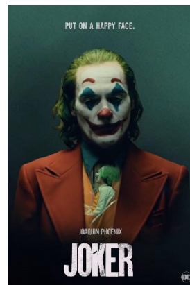
JOKER Filme traz boas reflexões sobre nossa sociedade atual e a forma como lidamos com a diversidade.