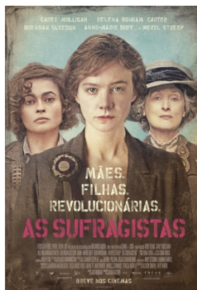
AS SUFRAGISTAS Excelente filme que traz história das mulheres no trabalho.