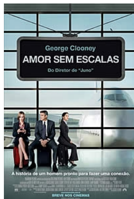
AMOR SEM ESCALAS Esse filme trata pouco do que vivo pelos aeroportos. Focar nas demissões e o quanto você está preparado para isso.