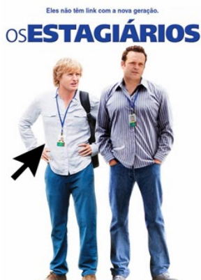
OS ESTAGIÁRIOS Filme trata dos conflitos de geração. Assistir com foco na diversidade.