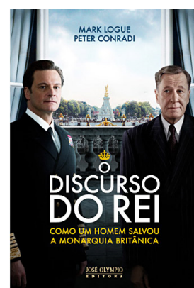
DISCURSO DO REI Assistir filme com foco na superação da habilidade da oratória.